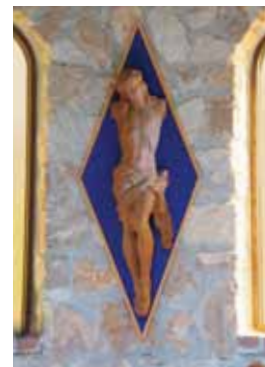
Scultura lignea nella Chiesetta dell'impegno a San Biagio di Subiaco (Roma).